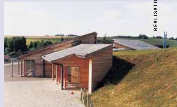
▲ Vue des bâtiments adossés à la colline.

◀ Sur toute la profondeur du bâtiment, le préau offre un grand espace sous abri.