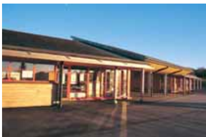
▲ Toutes les salles d'activité ouvrent directement sur la cour.

Du haut du talweg où ils sont situés, les deux bourgs de Saint-Hilaire-le-Châtel et de Sainte-Céronne constituent un paysage de toitures d'où seuls émergent les clochers d'églises. L'architecture du groupe scolaire fait explicitement référence à ce profil traditionnel de groupement du bâti. Le terrain d'assise qui présente une forte déclivité, d'environ 12 m, jouit d'un bon ensoleillement par son exposition ouest et d'une vue imprenable sur le paysage vallonné